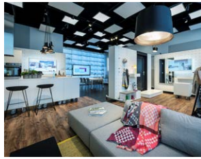
Lebensbereiche in verschiedenen Konstellationen